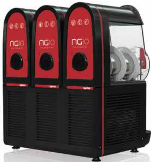
NG 10 / 3 easy black