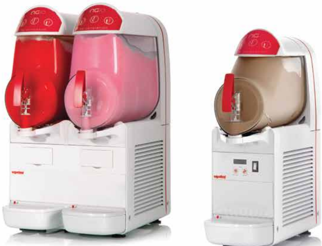
NG 10 / 2 easy NG 6 / 1 easy ETC