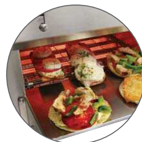
Panini, sandwiches, toasts, bruschetta 1'30 min