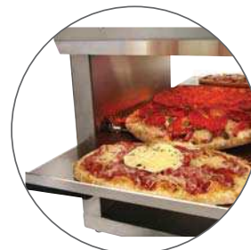
Pizzas Ø 30 cm 1'30 min / Mini-pizzas 50 s