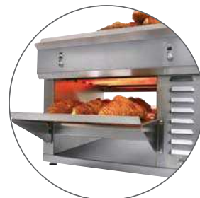
Croissants 50 s

Entretien facile : le toit et les 2 bacs récupérateurs entièrement amovibles.