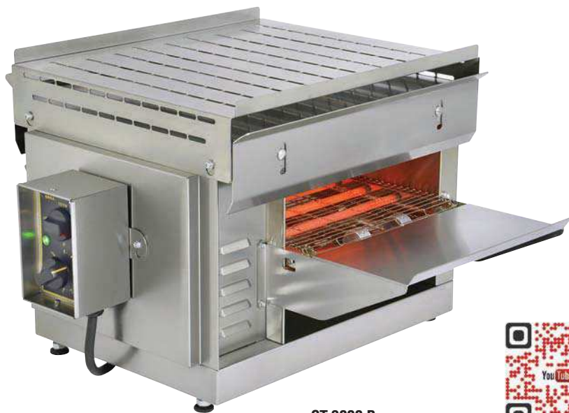
CT 3000 B