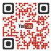
Video CT 3000 B.