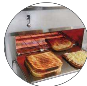
Croque-monsieur 1'30 min

Ideal for intensive use in bakery, fast-food chains and franchises !